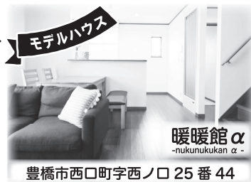
暖暖館α nuku nuku kan 豊橋市西口町字西ノ口25番44