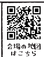
会場の地図はこちら

土地から取得して デザインハウス『HIRAYAα』をベースに 児童発達支援放課後デイサービスの 施設を建築しました。